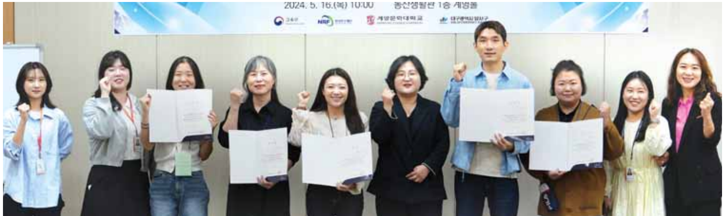
2024년 HiVE사업단 서포터즈

계명문화대학교 HiVE사업단은 성공적인 사업운영과 우수한 성과창출을 기반으로 대구·경북권역에서 최고 등급인 A등급에 선정됐다. 또한 이