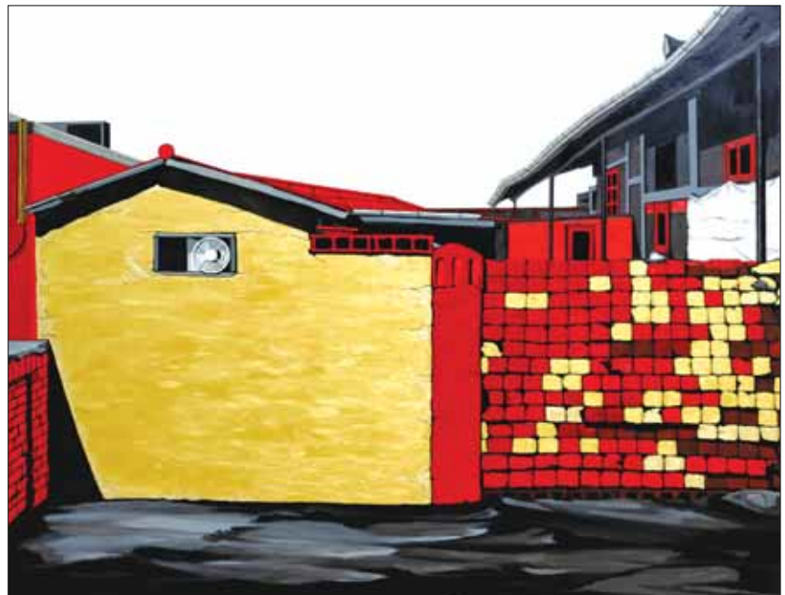
신건우 그림자 도시 - 국가유공자의 집, 2024, Oil and Acrylic on canvas, 130x102cm

으로 보이는 극기적인 풍경들을 전시장에 있는 약 6m 정도의 캔버스 화면에 라이프드로잉으로 그려낸 예전이다. 전시기간 중 완성된 드로잉과 그 과정을 담은 영상까지 전시장에서 볼 수 있을 것이며, 전시장을 가득 채운 크기의 작품은 관람객에