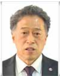
대구달성교육지원청 교육장 조성철

올해도 변함없는 관심과 사랑으로 지켜봐 주시고 군민 여러분 가정에 행복과 건강이 가득한 한 해가 되시길 기원합니다. 새해 복 많이 받으십시오. 감사합니다.