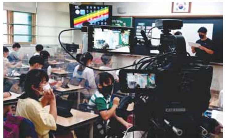
유기초에서 '온라인 콘텐츠 활용 교과서 수업'을 하는 모습

대구시교육청 관계자는 "학교의 온·오프라인 연계 수업 경험들과 교사가 직접 만들어