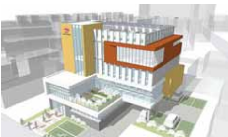
감삼동 행정복지센터 조감도

달서구는 지난 3일 감삼동 청사 신축에 따라 감삼동 행정복지센터를 당산로 176, 중국문화원 옆으로 임시 이전 개소하고 업무에 들어갔다.