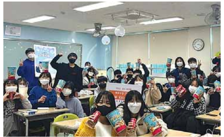
경서 '우연제' (학제) 활동

적극적이고 탄력적인 교육과정으로 학생의 일상회복과 또래 활동 강화에 힘썼다.