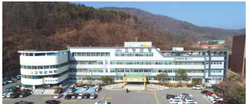
한편 이번 시상은 당초 종무식 때 하는 것으로 변경됐다. 진행 예정이었으나 코로나 19의 재유행으로 인하여 상패는 개별 전달

곽용환 고령군수는 “기업인의 경쟁력이 곧 고령군의 경쟁력임을 강조, 기업 역할의 중요성과 균형발전에 많은 관심과 협조”를 당부하며, 앞으로도 기업하기 좋은 도시 육성을 위한 기업 친화적 시책을 지속적으로 추진해 나갈 것임을 약속했다.