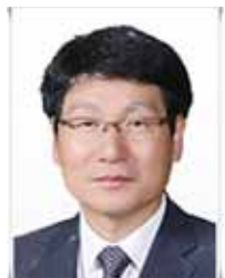
대구남부교육지원청 교육장 소상호

2022년 새해에도 구민 여러분의 가정과 직장에 늘 건강과 행복이 가득하길 기원합 니다. 새해 복 많이 받으십시오.