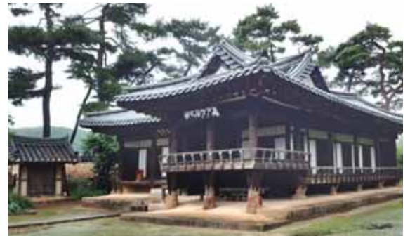
건축미가 뛰어난 화원읍 인흥마을 광거당

석축이나 단상 위에 높게 세운 건물로 건물의 격으로 보면 상당히 높은 건물이다. 하지만 건물의 격이 높다고 무조건 건물의 규모도 큰 것은 아니다. 정려·비·영정 등을 보호하기 위해 건립한