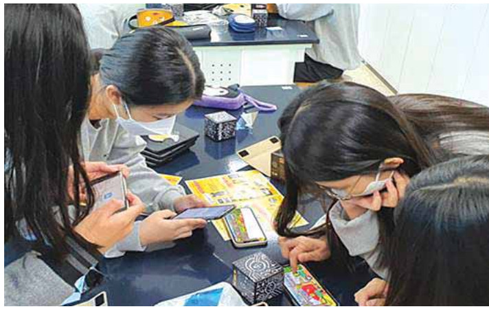
주제통합 프로젝트 활동

지난 2021동안 경서중학교는 코로나 19로 인해 교육 활동이 위축되는 상황 속에서도