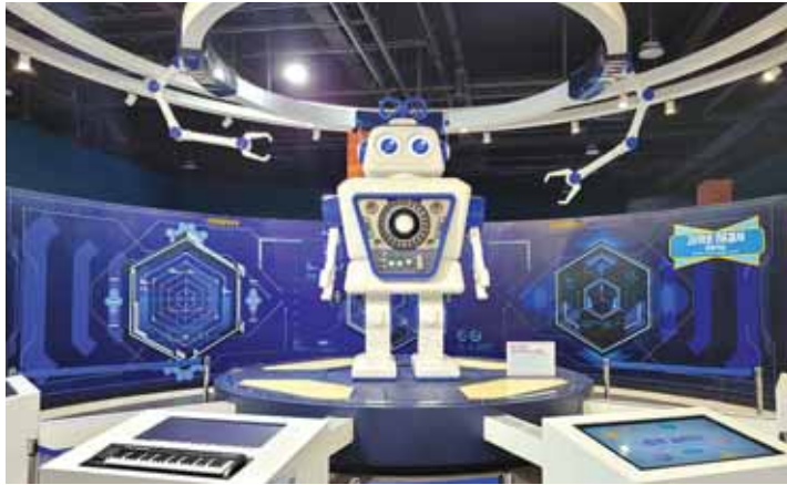
어린이과학관 아이들월드 전시관 모습

2층 ‘아이들월드(어린이과학관)’는 유아(3~7세)와 어린이(8~13세)들이 다양한 과학 전시품을 체험하며 발견과 탐구의 과정을 거쳐 미래 핵심 역량을 키울 수 있다. 특히, ‘아이들월드’의 모든 전시물과 시설물은 아이들의 눈높이와 안전을 최우선으로 고려해 설계됐다.