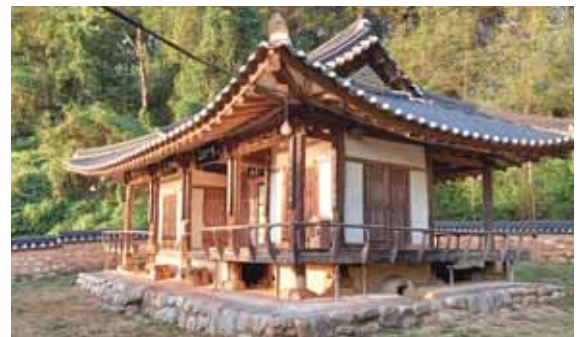
경관이 아름다워 제일강산정,이라 불리는 구지면 이로정

정려각·비각·영각이나 사찰의 산신각처럼 소규모 건물도 많기 때문이다. 현풍읍 현풍곡씨2정려각, 구지면 도동서원 한훤당선생신도비각, 옥포읍 충주석씨 영정각, 달서구 대곡영각 등이 있다.