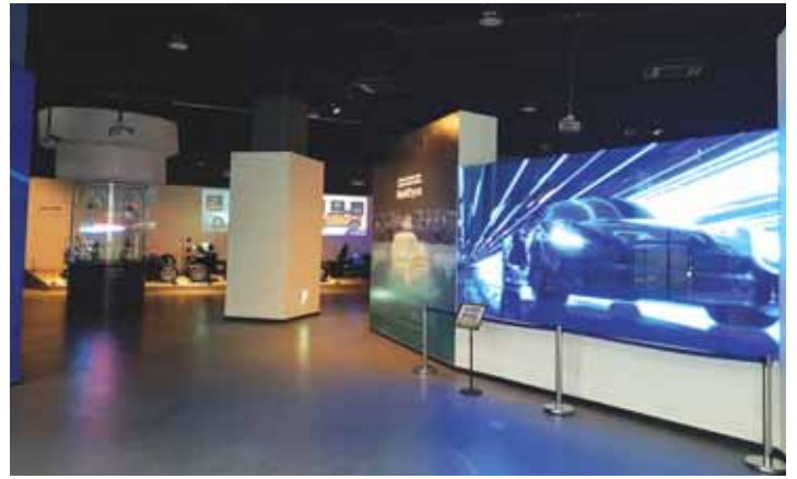
자동차전시관 모빌리티움 전시관 모습

3층 ‘모빌리티움(자동차전시관)’은 대구시 5대 미래 성장 동력 중 하나인 미래형 자동차 기술 분야를 쉽고 재미있게 이해할 수 있도록 전시를 기획했다. 전기차, 수소차, 자율주행차 등 총 35점의 전시품을 통해 미래 자동차의 첨단 기술 개념을 체험하고