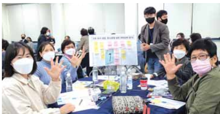
2021년 권역별 주민마스터 원탁회의

운영하여 구민 또는 공무원이 온라인, 우편, 방문 등의 방법으로 제안한 우수한 의견은 100% 반영해 행정의 혁신을 도모한다.