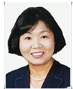
달성교육지원청 교육장 김영옥

앞으로도 달성은 대구의 큰집이자 마래로서 변함없이 초심을 지키며 군민 여러분께 진심을 다하겠습니다. 새해 복 많이 받으십시오. 감사합니다.