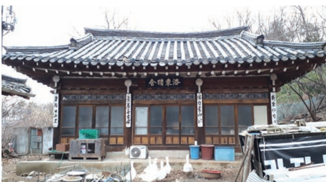
폐가인 뚝 방치되어 있는 낙동정사

‘옥에 흙이 묻어 갈가에 버렸더니/오는 이 가는 이 흙이라 하 는구나/두어라 알 이 있으니/ 흙인 듯이 있거라’ 팔자가 찰져 암 송하는 공재 윤두서의 시조다. 필자처럼 향토사를 공부하는 이들 에게는 공통된 특징이 하나 있다. 흙이 묻어 갈가에 버려진 옥(?) 을 알아보는 눈이 남다르다는 것. 남들은 무심코 지나치는 장소 지만 향토사를 공부하는 이들의 눈에는 가는 곳마다 시선과 발걸 음 붙잡는 옥들이 있으니 말이다. 이번에는 화원동산 사문진 나 루 입구 오른쪽 언덕 비탈에 흙이 묻은 채 버려져 있는 옥에 대해 알아보기로 하자. 이 옥의 이름은 낙동정사(洛東精舍)다.