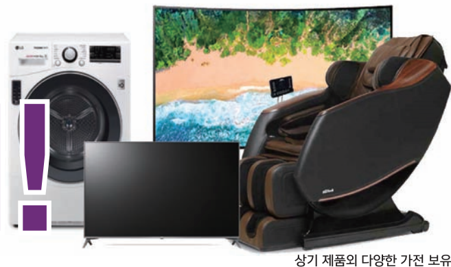
상기 제품의 다양한 가전 보유