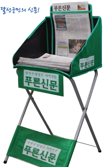
많은 마음 많은 신문! 60만 달서구·달성군민의 신문!