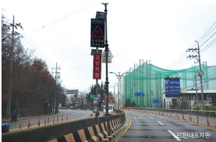
광고문의 053. 572-6000