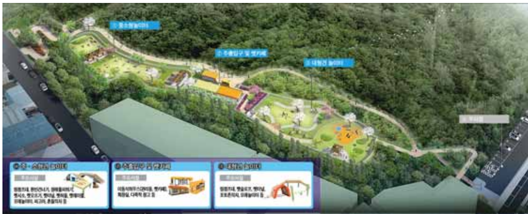
달서 반려견 놀이터 조감도