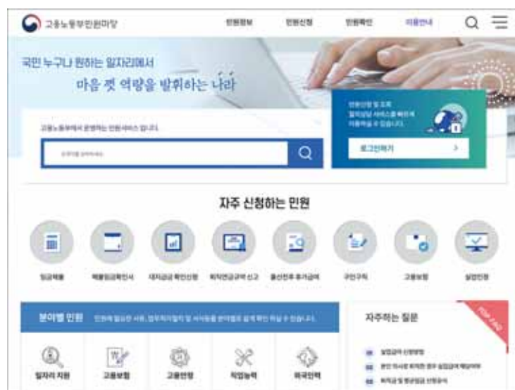
고용노동부민원마당에서 손쉽게 고용관련 이슈를 검색 질의할 수 있다 _ 고용노동부민원마당 홈페이지

https://minwon.moel.go.kr/minwon2008/index_new.do (고용노동부 민원마당을 통해서 필요 정보를 검색하고 빠른 상담을 받아볼 수 있다)