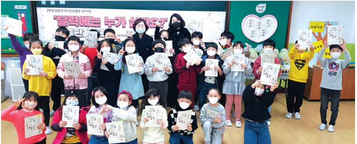
‘달력에는 누가 살까요?’ 출판(발간)기념회

이번에 발간한 책은 ‘달력에는 누가 살까요?’라는 질문에 대한 답을 찾아가는 과정의 책으로 모두 3장으로 이루어져 있다. 1장은 달력의 기념일에서 만난 사람들, 2장은 달력에서 만난 우리 가족, 3장은