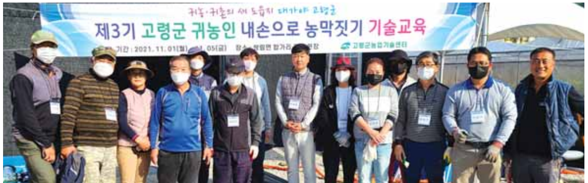
21년 농막짓기 기술교육

가능하며, 신청을 희망하는 귀농인은 거주지 읍·면사무소 산업팀에 귀농인 정착지원금신청서 등 관련 서류를 제출하면 현지 확인 후 적합하면 익월부터 지원한다.