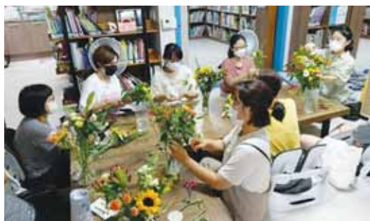
경단녀들의 사회복귀를 위한 마을아카데미