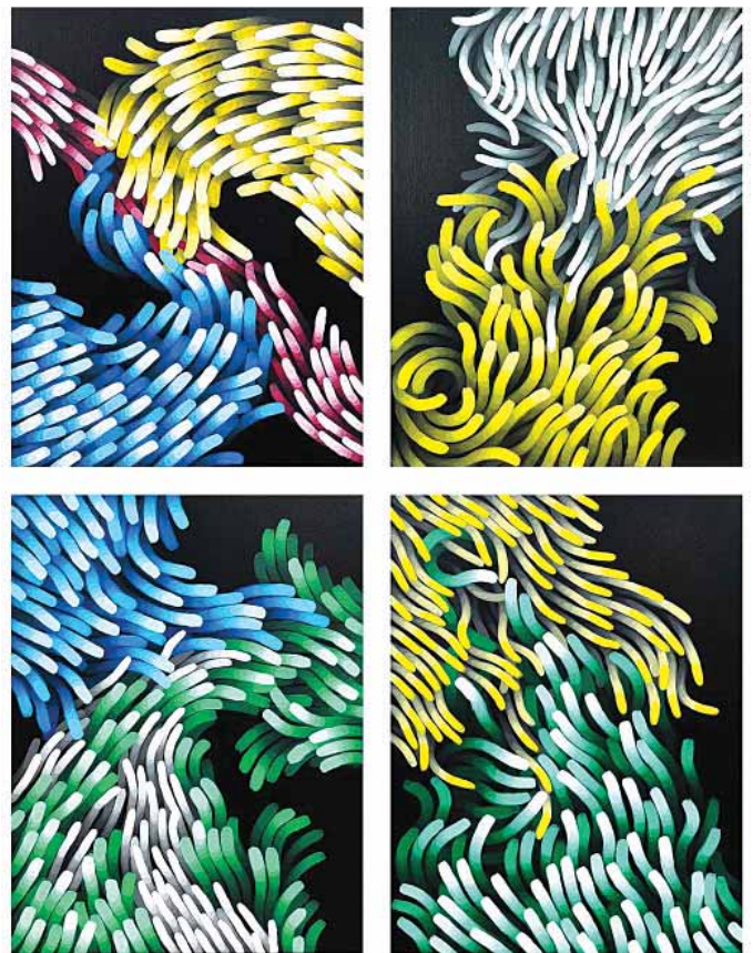
김재홍 작가(평면) 내면의 조우, Acrylic on canvas, 35.0×27.3cm×4ea, 2022