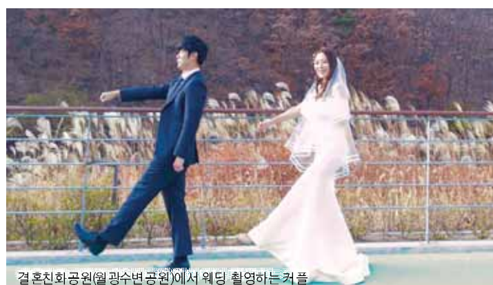
결혼친화공원(월광수변공원)에서 웨딩 촬영하는 커플

에게는 원고료 5만 원도 추가 지급될 예정이며, 문의는 달서구 여성가족과 결혼장려팀(☎ 667-3791~3)으로 하면 된다.