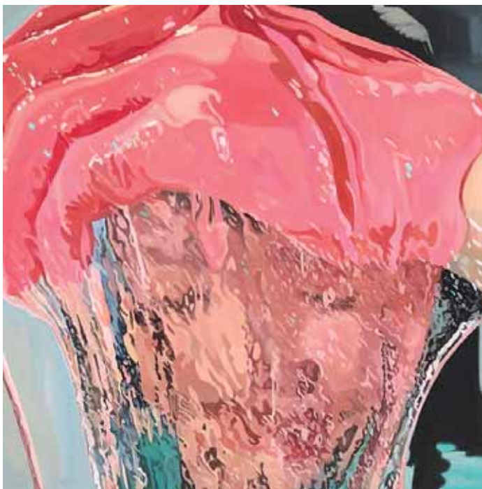
박두리 작가(평면) 미끄러움과 경계의 이미지, 캔버스에 오일, 130cm×130cm, 2020.