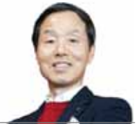
구용회 건강사이버대학교 교수

현대그룹을 창업한 정 주영 회장(1915~2001년). 그의 성공 신화의 비결은 남다른 통찰력, 창의력, 사고의 기동성, 추진력 등이 아닌가 생각한다. 이미 알려진 내용이지만 그는 어렸을 적에 고향인 강원도 통천의 시골집에서 청개구리 집 짚의 나무 가지에 오르기 위해 실패를 거듭하면서 포기하지 않고 오를 때까지 시도해 결국 성공하는 모습을 보고 ‘결코 포기하지 않는다’는 교훈을 배웠다. 또 어느 날 닭장에서 달걀을 훔쳐가는 쥐의 모습, 즉 한 마리의 쥐가 네 다리로 달걀을 끌어안으면 다른 쥐가 달걀을 안은 쥐의 꼬리를 물고 끌고 가는 모습을 보며 혼자서 안 되는 일도 힘을 합하면 이뤄내는 ‘협동의 힘’을 배웠으며, 인천 부두에서 막노동하던 시절 밤에 빈대 때문에 잠을 이룰 수 없자 빈대가 물을 싫어하는 습성을 알고 책상 다리마다 물을 채운 세숫대야를 받쳐 놓고 책상 위에서 잠을 이루었으나 다음 날 빈대는 머리를 써서 직접 공격이 어려워지자 벽을 타고 우회전으로 접근하여 천장에서 정확하