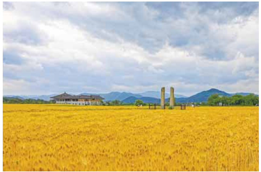
일반부문 대상 ‘황룡사지의 봄날’

일반부문 대상에는 ‘황룡사지의 봄날’ (백영기 작)이 차지했으며, ‘역겹의 세월을 서서’ (김기수 작)와 ‘천년 고분군 가을의 아침’ (김상석 작)이 최우수상을 수상했다. 우수상에는 ‘님 가시는 길’ (오병준 작), ‘안동의 밤’ (정용호 작)이 선정됐