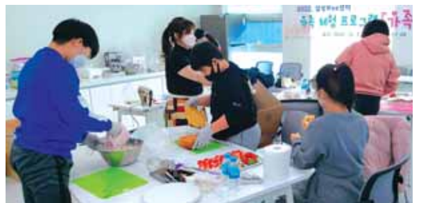
달성교육지원청 Wee센터 가족과 함께하는 케이크 만들기 행사

달성교육지원청(교육장 이두희) Wee센터는 지난 3일(토)에 달성Wee센터 상담 및 프로그램 참여 학생 가족을 대상으로 가족과 함께하는 케이크 만들기 행사를 실시했다.