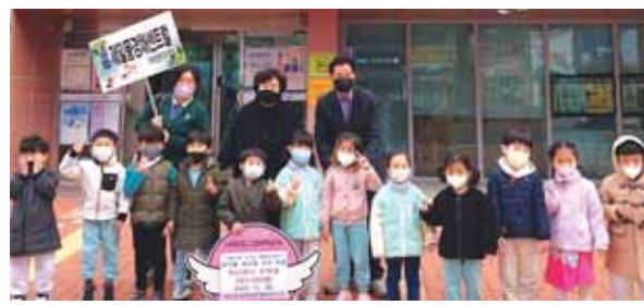
제일풍경채센터어린이집, 성금 86만 원 기부 유가읍에 위치한 국공립 제일풍경채 센터어린이집에서 행정복지센터를 방문해 아나바다 바자회 수익금 86만 원을 기부했다.