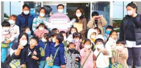
구지면 반도아이사랑 어린이집, 성금 기탁 달성군 구지면 반도아이사랑 어린이집이 지난 11월 29일(화) 바자회 행사 수익금 132만 원을 구지면 행정복지센터에 이웃돕기 성금으로 기탁했다.