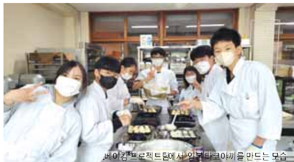
베이킹프로젝트팀에서 일일타르트야기를 만드는 모습

‘찾아가는 음악회’가 열렸다. 코로나로 한동안 공연 문화에 목말라 했던 학생들과 교직원들에게 하모니의 감동과 함께 행복한 시간을 선사했다.