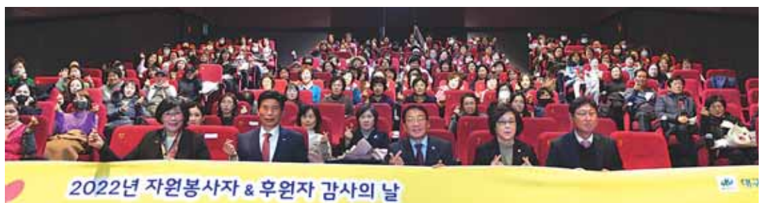
2022년 자원봉사자 & 후원자 감사의 날

달서구 공무원들로 구성된 '청리언덕 제1회 음악회'가 지난 3일(토) 푸른방송 아트홀에서 열렸다. 음악과 기타를 좋아하는 달서구 공무원들로 구성된 '청리언덕' 동아리와 '삼투압' 밴드가 평소 틈틈이 연습하고 준비한 곡들로 첫 음악회를 개최했다. 전재경 객원기자