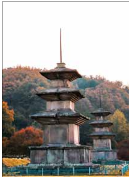
SNS 부문 대상

공모전 심사는 관광, 콘텐츠, 사진 분야 전문가 4명이 주제적합성, 활용성, 창의성, 완성도를 평가하고 온라인 평가(공식 홈페이지와 공식 SNS에 리그램한 게시물의 조회(좋아요)수)를 합산하여 총 36점(▲일반부문 대상 1, 최우수 2, 우수 2, 특별 1, 장려 5, 입선 20, ▲SNS부문 대상 1, 최우수 2, 우수 2)을 선정해 공식 홈페이지(www.gbphotocon