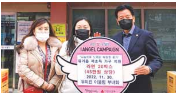
유가읍 우미린 아파트 어울린 부녀회, 라면 기부 유가읍 위치한 우미린 아파트 어울린 부녀회에서 유가읍행정복지센터를 방문해 라면 20박스를 기부했다.