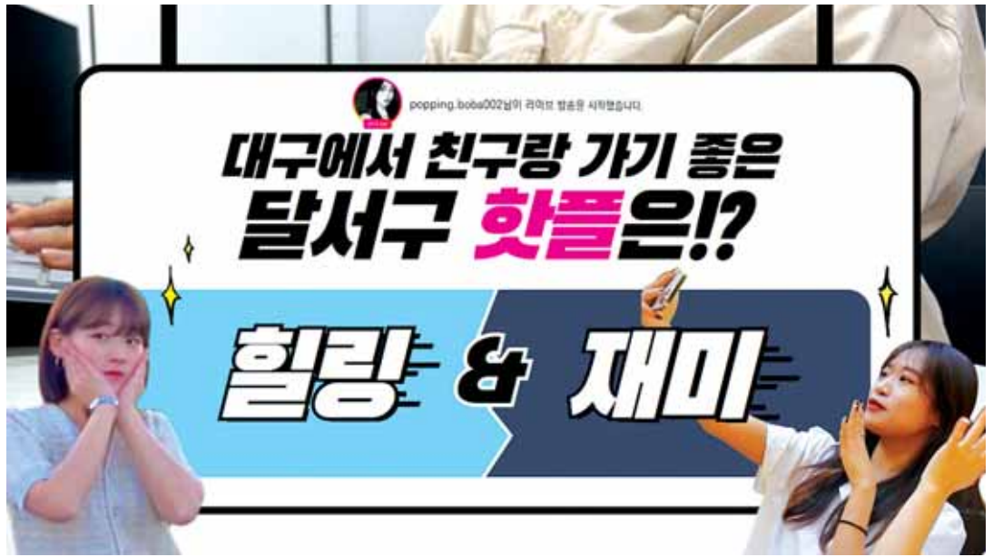
‘제3회 희망달서 SNS 영상콘텐츠 공모전’ 대상작

이태훈 달서구청장은 “이번 공모전에 감각적이고 참신한 작품을 출품해준 모든 창작자 분들께 감사드린다. 당선작을